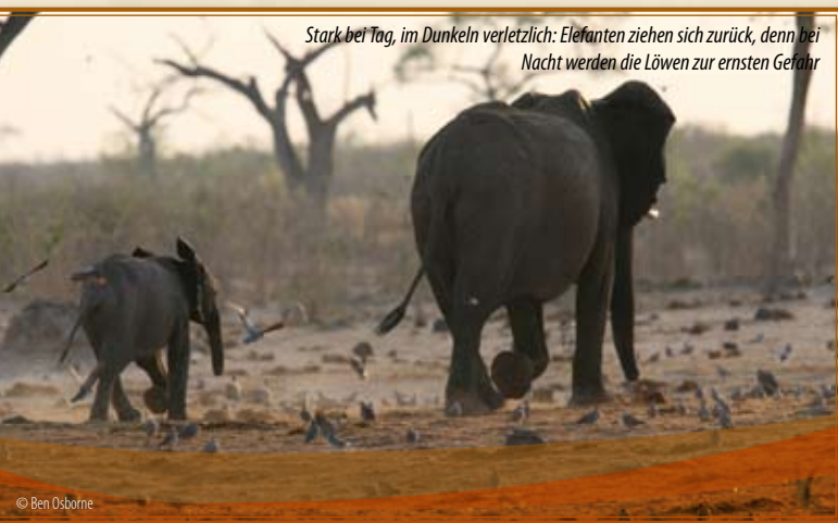
Stark bei Tag, im Dunkeln verletzlich: Elefanten ziehen sich zurück, denn bei Nacht werden die Löwen zur ersten Gefahr

Wer genau hinschaut, „sieht“ eine Figur, ein Gesicht oder eine magische Linie, Schatten und Lichtreflexe. Das versucht man so genau wie möglich als Bleistiftzeichnung festzuhalten, die Zeichnungen werden gemeinsam betrachtet. Wer ein Fotohandy hat, unterstützt seine visuelle Erinnerung durch Schnappschüsse (zusätzlich zur Zeichnung nach dem Original).