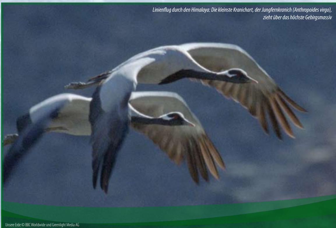
Linienflug durch den Himalaya: Die kleinste Kranichart, der Jungfernkranich ( Anthropoides virgo ), zieht über das höchste Gebirgsmassiv

Das klare Ziel wäre eine globale Politik und Wirtschaft der Nachhaltigkeit. Wir dürften der Natur nicht mehr als das entnehmen, was auf natürliche Weise nachwächst. In dieser Hinsicht beginnt Artenschutz bei ganz alltäglichen Entscheidungen und ist eine Aufgabe für jeden von uns. Welche Leistungen vermag Homo sapiens zu vollbringen? An Tipps und Anleitungen mangelt es bekanntermaßen nicht.