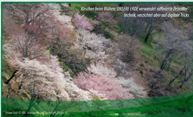
Kirschen beim Blühen: UNSERE ERDE verwendet raffinierte Zeitraffer-technik, verzichtet aber auf digitale Tricks

Die Protagonisten werden oft durch kleine Spannungsbögen eingeführt. Wir warten kurz, sehen dann einen Ausschnitt, etwa Affenhand oder Eisbärnase, schließlich folgt das ganze Geschehen. Auf subtile Weise erzählt sich jede Teilgeschichte selber. Leitmotivische Gedanken unterstützen das: Jede Bewegung, jede Aktion dient überall dem Überleben, ob Jagd, Futtersuche oder Partnerwerbung. Schönheit beherrscht das Große wie das Kleine. Ästhetische Komposition dominieren die ganze Bandbreite von idyllischen, lustigen, dramatischen und tragischen Szenen.