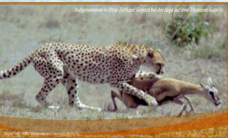
Aufgenommen in Ultra-Zeitlupe: Gepard bei der Jagd auf eine Thomson-Gazelle

Für zahlreiche Aufnahmen verwendete man einen Hubschrauber als fliegenden „Kamerakran“. Entscheidend war die neuartige Kameraaufhängung vorn unter der Kabine (Heligimbal Technology). Die Kamera ist kardanisch gelagert und dadurch dreidimensional frei drehbar. Das kreiselstabilisierte System schirmt außerdem die unvermeidlichen Vibrationen des Hubschraubers ab, die bei normalen Aufnahmen zum Verwackeln führen. Der Kameramann steuert die Aufnahme vom Co-Piloten-Sitz aus mit Bildschirm und Joystick. Deutlich wird die Funktionsweise beim Überflug des Wasserfalls mit kombiniertem Horizontal- und Vertikalschwenk: Eine derart präzise geführte, ungeschnittene, stabile Aufnahme ist mit keiner anderen Technik denkbar. Besser noch, die Stabilität der Aufhängung erlaubt es, starke Teleobjektive zu verwenden und Tiere aus großer Entfernung heranzuzoomen. Dennoch, auch diese Technik hat ihre Grenzen, die schlicht durch das Fluggerät vorgegeben sind.