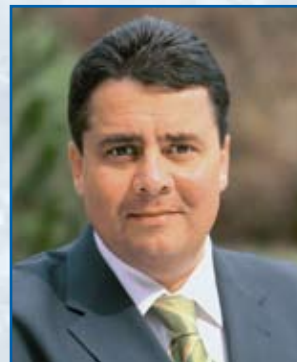
Sigmar Gabriel Bundesminister für Umwelt, Naturschutz und Reaktorsicherheit

Daher bitte ich Sie um Ihre Unterstützung. Sollen sich auch zukünftige Generationen noch über den Reichtum der Natur freuen und ihn nutzen können, dann gilt es auch Schülerinnen und Schülern zu zeigen: Der Verlust der biologischen Vielfalt betrifft uns alle, und wir sind gemeinsam verantwortlich.