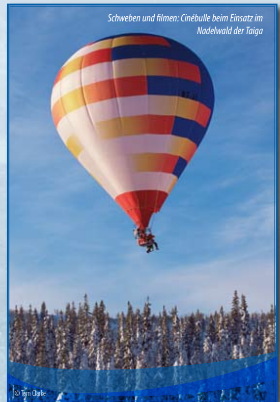
Schweben und filmen: Cinébulle beim Einsatz im Nadelwald der Taiga

Regisseur Fothergill, von Hause aus Zoologe, hatte sich bereits für DEEP BLUE anspruchsvollste (Unterwasser-) Technik zunutze gemacht. UNSERE ERDE dringt filmisch in sämtliche Teile der Biosphäre vor. Diese Produktion lässt hochentwickelte Dokumentartechnik auf Naturphänomene und Lebewesen treffen, von denen einige bereits im Verschwinden begriffen sind. Der beispiellose dokumentarische Aufwand eröffnet Blicke auf Tiere und Landschaften, die anders nicht realisierbar gewesen wären. Und die selbst eine entwickeltere Technik der Zukunft möglicherweise nicht mehr zeigen kann – wenn bis dahin entscheidende Akteure verschwunden sind.