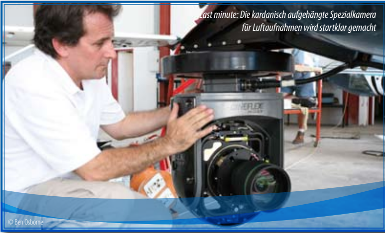
Last minute: Die kardanischn aufgehängte Spezialkamera für Luftaufnahmen wird startklar gemacht