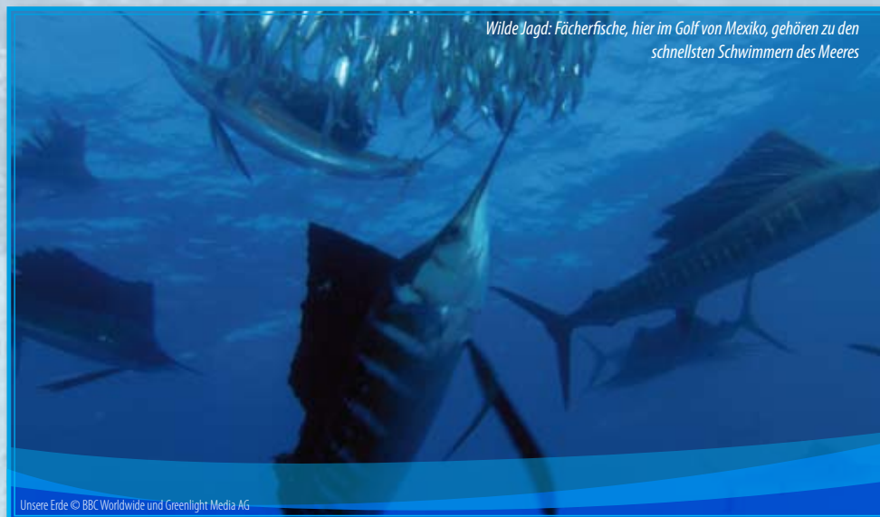
Wilde Jagd: Fächerfische, hier im Golf von Mexiko, gehören zu den schnellsten Schwimmern des Meeres