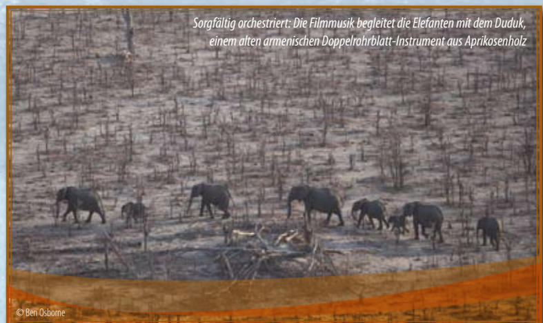
Sorgfältig orchestriert: Die Filmmusik begleitet die Elefanten mit dem Duduk, einem alten armenischen Doppelrohrblatt-Instrument aus Aprikosenholz

Als die Mandarinenten flügge werden, orchestriert ein kleines Scherzo ihr verlangsamtes Plumpsen, mit präzise auf den Moment der einzelnen Landungen hinsteuernden Crescendi. Zeitgleich rascheln beim Auftreffen der Entchen in Zeitlupe überdeutlich die Blätter. Ein Violin-Vibrato untermalt die Bewegungen der gefährdeten Amur-Leoparden. Der Stimmenmix im Urwald ist unentwirrbar wie der Dschungel selbst, dazu überlagern sich wie per Zoom zusammengedrängt Schnarren, ferne Rufe, Schettern, Gurren und Hüpföne. Wassergeräusche und Musik verschmelzen in dem Moment, in dem starke Zeitlupe den Angriff des Weißen Hais in seiner ganzen Gewalt erkennen lässt. Jedesmal hören wir, was geschieht, und spüren, was es bedeutet. Wir sind unmittelbar dabei, auch akustisch und emotional voll „im Bild“.