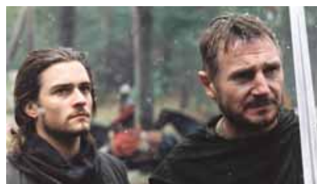
Balian und Godfrey von Ibelin

Der weise König toleriert alle Religionsgemeinschaften in seiner Stadt, aber er ist durch seine tödliche Lepraerkrankung deutlich geschwächt. Dadurch wächst die Macht der christlichen Fanatiker, welche die Alleinherrschaft der Christen beanspruchen. Sie verüben immer wieder Übergriffe auf die muslimische Bevölkerung. Lediglich sein langjähriger Berater Tiberias steht dem König noch