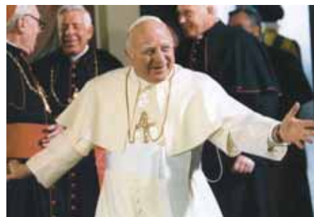
Bob Hoskins als Papst Johannes XXIII.

Die Besetzung von Hoskins als Papst ist durchaus überraschend. Der Schauspieler bekennt sich offen dazu, überzeugter Atheist zu sein. Schon als Kind sträubte er sich gegen die Vorstellung „eines alten Mannes, der von oben zu uns hinunter sieht“ (Quelle: Presseheft des Verleihs). Deshalb kam das Angebot für ihn ziemlich unerwartet. Dem britischen Magazin Empire beschrieb er den Anruf der Produzenten folgendermaßen: „Bob, wir lieben dich. Du bist so dick. Du bist so klein. Komm nach Italien, spiel den Papst.“ (Quelle: Presseheft des Verleihs).