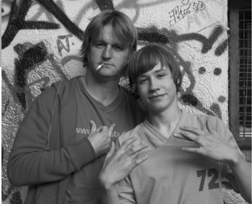
Detlev Buck (links) mit seinem Hauptdarsteller David Kross

Der Film KNALLHART orientiert sich stark an der gleichnamigen Romanvorlage, es sind aber auch einige Unterschiede vorhanden. Im Roman ist sich Miriam nicht zu fein, zum Sozialamt zu gehen, das Jugendamt hat ein Auge auf Crille und Matze, und Michael gibt sich humorvoller und weniger introvertiert. Auch der Schulalltag und die Lehrer spielen eine größere Rolle. Hamal stammt hier nicht aus Afghanistan, sondern aus Syrien. Polizist Gerber umschwärmt Miriam nicht, er ist einfach nur ein dicklicher menschenfreundlicher Beamter. Dass Michael Dr. Peters' Kreditkarte mit der Geheimzahl entwendet, macht das erfolgreiche Geldabheben beim Bankautomaten plausibler. Vor allem aber ist Michael im Roman nicht so zögerlich bei Erols Hinrichtung. Besonders gravierend ist auch eine weitere Abweichung: Im Roman versucht Erols Gang, Michael aus einer fahrenden S-Bahn zu stoßen. Im Film wurde daraus die Baseballschläger-Szene im Parkhaus. Vielleicht mag sich diese Szene im Alltag tatsächlich so abspielen, der Film jedoch banalisiert ihre Gefährlichkeit, wenn Michael dreimal nahezu schutzlos mit aller Wucht von einem Baseballschläger getroffen wird und danach einfach wieder aufsteht.